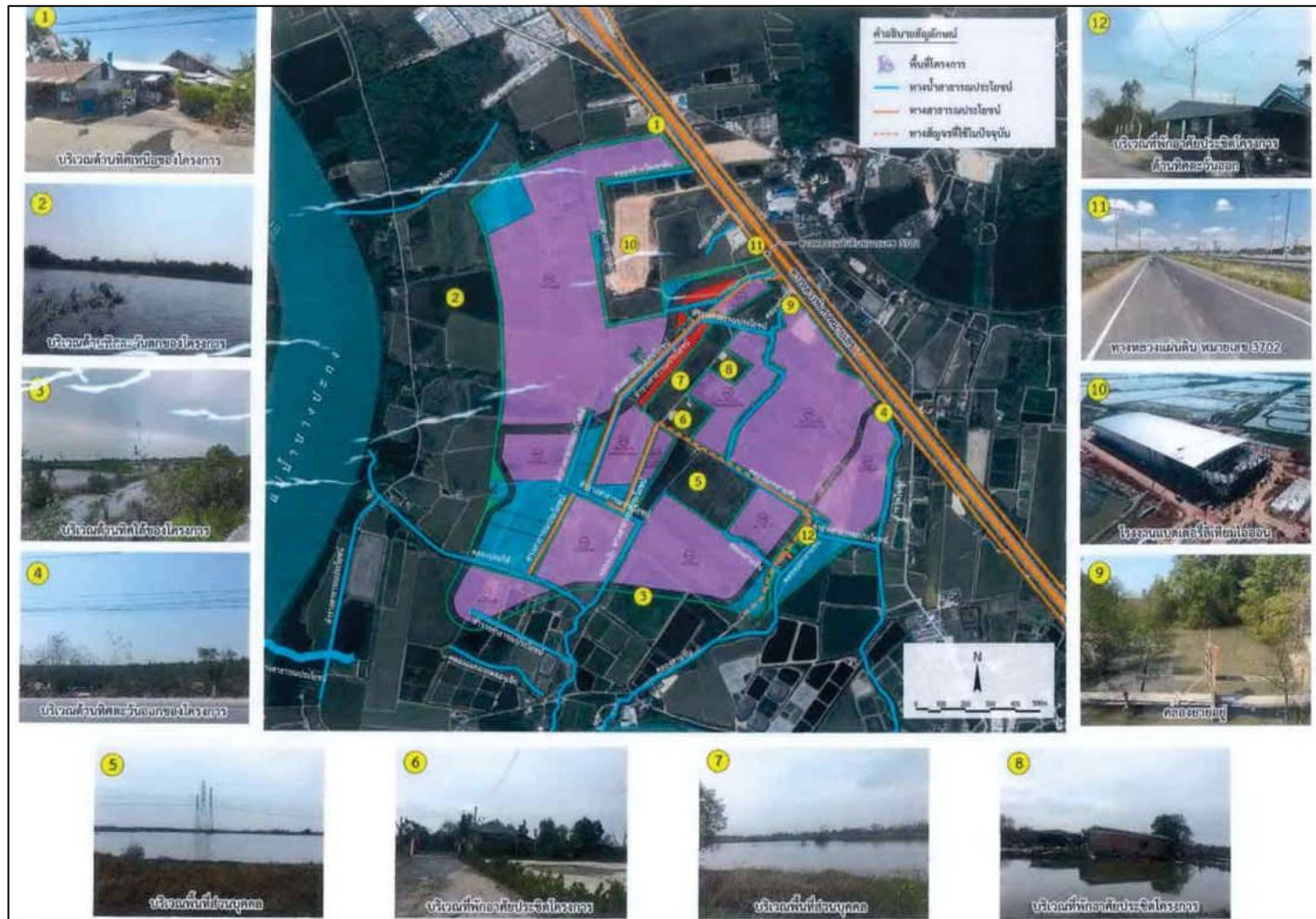
รูปที่ 1.2-2 อาณาเขตติดต่อกับพื้นที่โครงการ