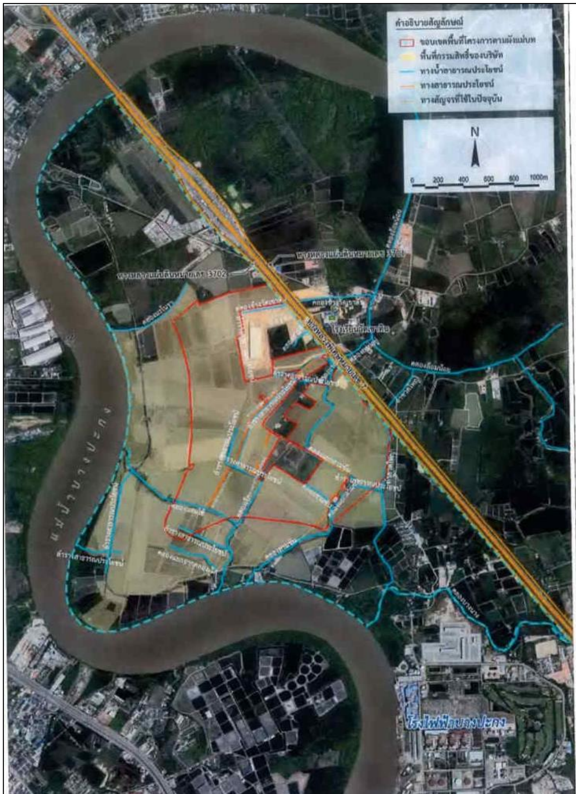
รูปที่ 1.2-1 ที่ตั้งโครงการ